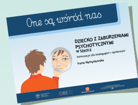
DZIECKO Z ZABURZENIAMI PSYCHOTYCZNYMI W SZKOLE