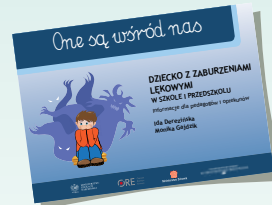
DZIECKO Z ZABURZENIAMI LĘKOWYMI W SZKOLE I PRZEDSZKOLU