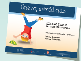
DZIECKO Z ADHD W SZKOLE I PRZEDSZKOLU