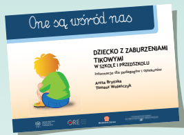
DZIECKO Z ZABURZENIAMI TIKOWYMI W SZKOLE I PRZEDSZKOLU

W drugiej serii „One są wśród nas” ukazały się: