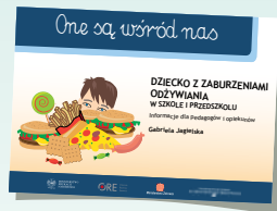
DZIECKO Z ZABURZENIAMI ODŻYWIANIA W SZKOLE I PRZEDSZKOLU