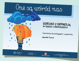
DZIECKO Z DEPRESJĄ W SZKOLE I PRZEDSZKOLU