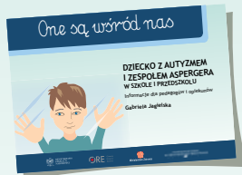
DZIECKO Z AUTYZMEM I ZESPOŁEM ASPERGERA W SZKOLE I PRZEDSZKOLU